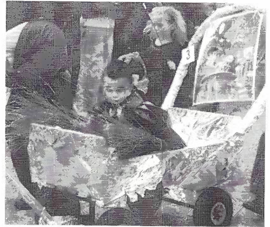
Kermis afschaffen? Brrr...ik moet er niet aan denken!

Het aan banden leggen van de feestelijke plechtigheden zou voorlopig nog niet zo'n vaart lopen. Immers het volk was zeer gesteld op die gebeurtenissen die de dagelijkse sleur kon verbreken. De kermis had uitein-