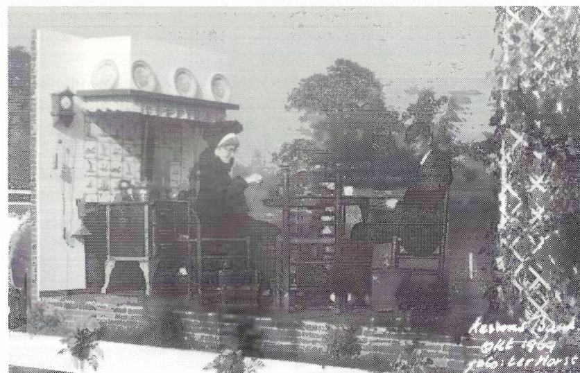
'Moeders wil is wet' uit 1969