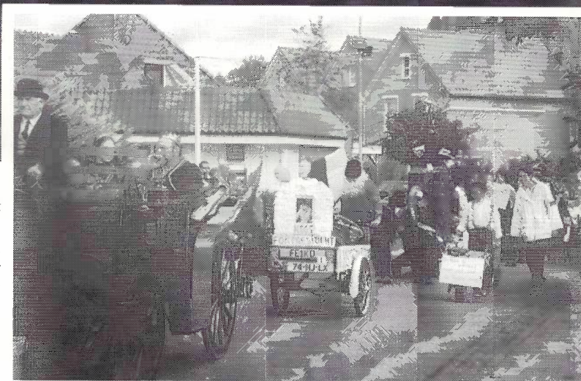
De Kermisoptocht in het jaar 2002.

De Heren hierboven zouden er van genoten hebben.