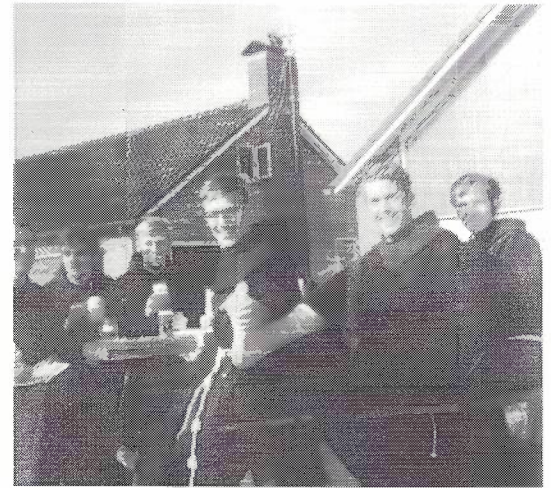
Beeld van de kermisviering in 1965: de 'Paters' zijn druk in de weer. Boven zijn ze bezig met 'laden' Hieronder is één van hen reeds begonnen met 'lossen'