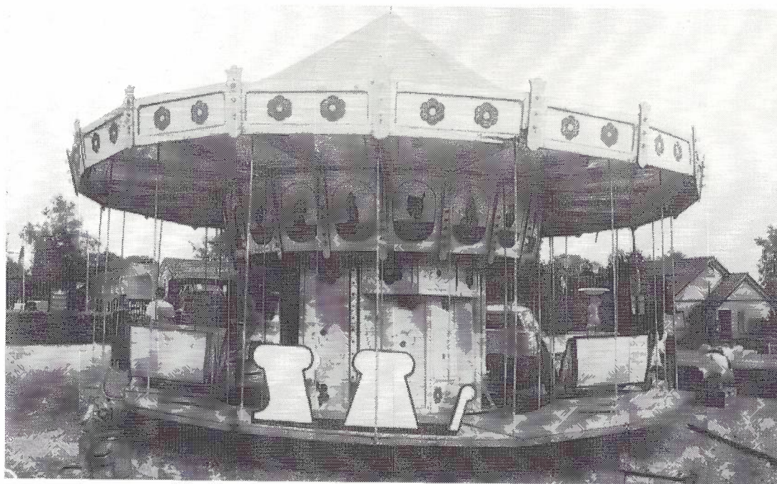
Op geen enkele kermis mag de draaimolen oftewel de carrousel ontbreken. Ook in Baak bijna altijd aanwezig.

hen werd bestreden. Maar voor het zover was, hoe vermaakte men zichzelf op de kermis?