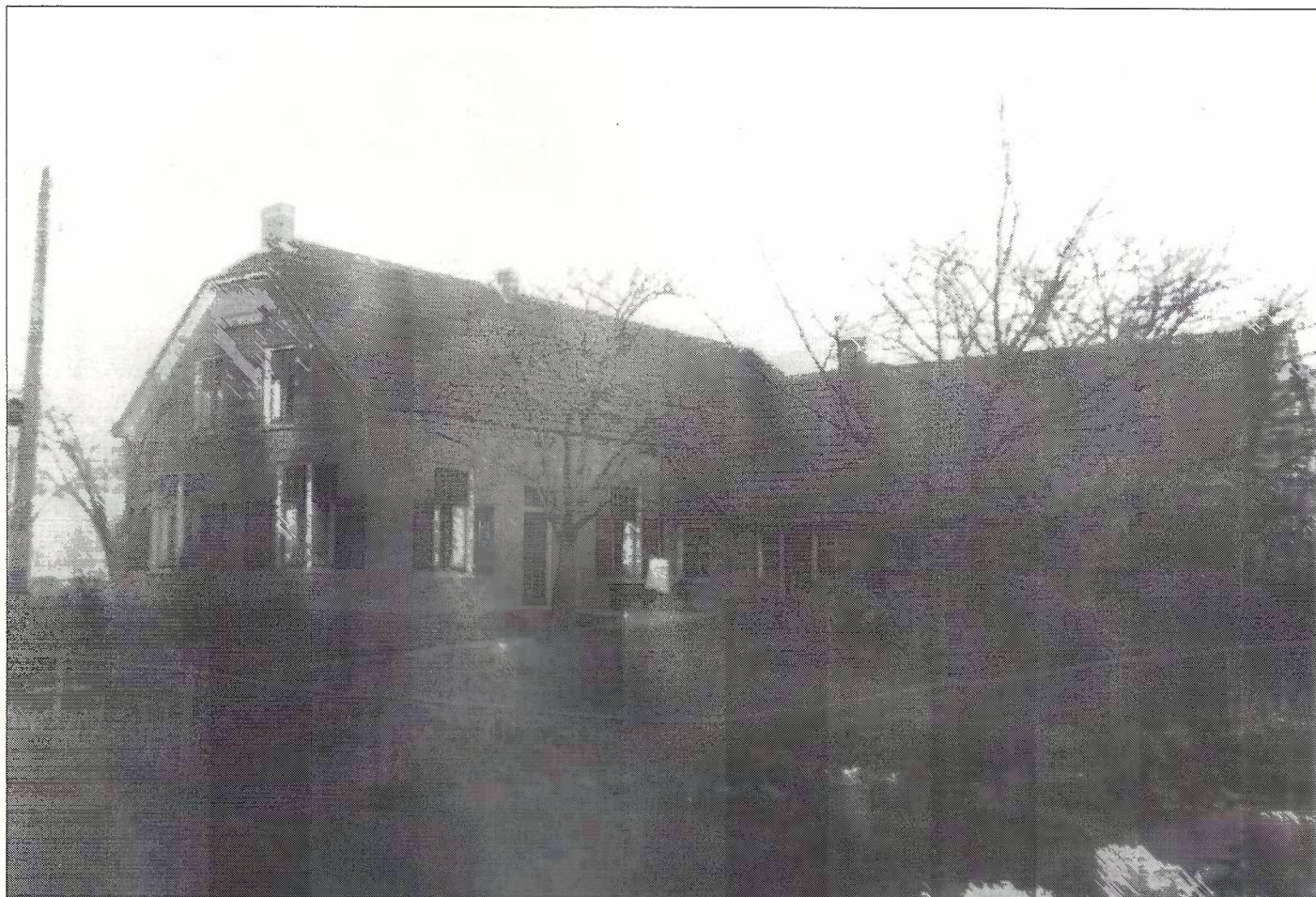
De boerderij Steenderdiek aan de Dr. A. Ariënsstraat. Zeer velen zullen dit plaatje herkennen

PERIODIEK ORGAAN VAN DE HISTORISCHE VERENIGING STEENDEREN