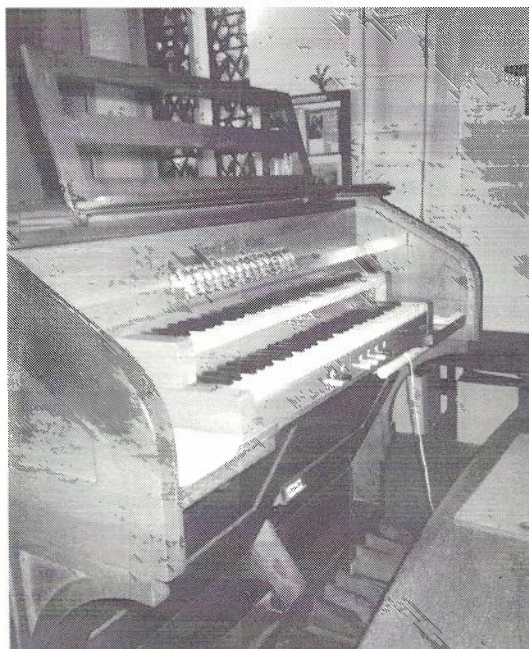
De speeltafel (klavieren) van het orgel in Olburgen

Het meest voor de hand liggende is dat Vermeulen het oude orgeltje heeft afgebroken en er een nieuw voor in de plaats heeft gezet, met gebruikmaking van oud pijpwerk, iets wat deze orgelbouwer wel vaker deed. Als dat zo zou zijn, zou het oude pijpwerk wel eens historisch materiaal kunnen zijn uit