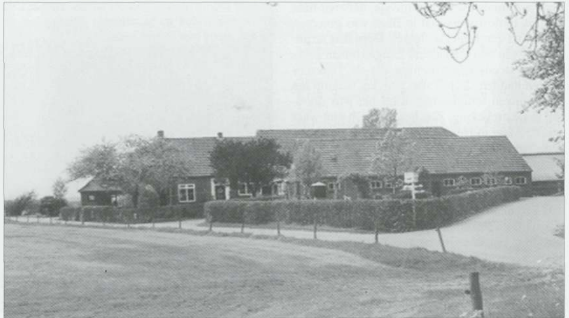
De Pellebartelsplaats in zijn huidige staat, na de wederopbouw na de oorlog.