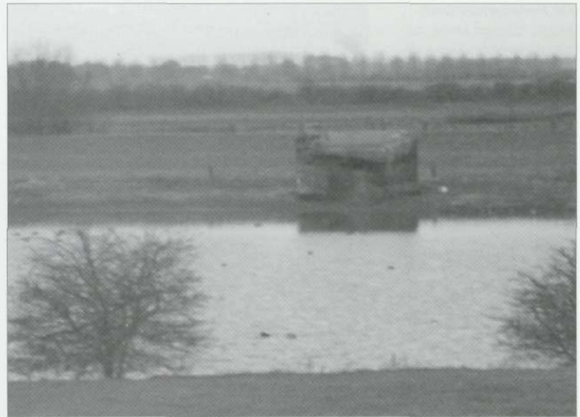
Een restant van al het oorlogstuig, net aan de overkant van de IJssel.

moeite meer gedaan om ook die laatste delen van Steenderen te bevrijden. Er werd verwacht dat ook Rha, Olburgen en de Luur snel vrij zouden zijn, er waren geen zorgen dat het nog lang zou duren. Maar dit viel tegen.