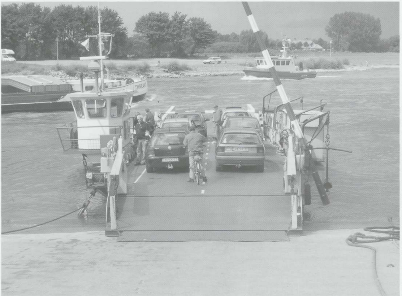
De veerpont bij Bronkhorst, zoals die heden in gebruik is.

redding was geweest, omdat de 'zwarte' niet over de sloot had kunnen springen.