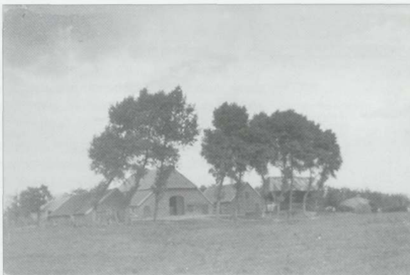
De boerderij De Pellebartelsplaats (Voor de oorlog)

In Toldijk was een stelling voor luchtafweer geplaatst door de Duitsers. Het doel was de verdediging tegen Canadese luchtaanvallen en het tegengaan van de bombardementsvluchten richting Duitsland. De apparaten zagen er indrukwekkend doch nogal mysterieus uit. De instrumenten zagen eruit als een groot rad met een doorsnee van ongeveer 5 meter. Het rad was bovenop een betonnen voet geplaatst. Een huisje stond er onder of naast. Een paar honderd meter verder stond nog zo'n geschut. Verscheidene barakken waren erbij gebouwd voor de Duitsers.