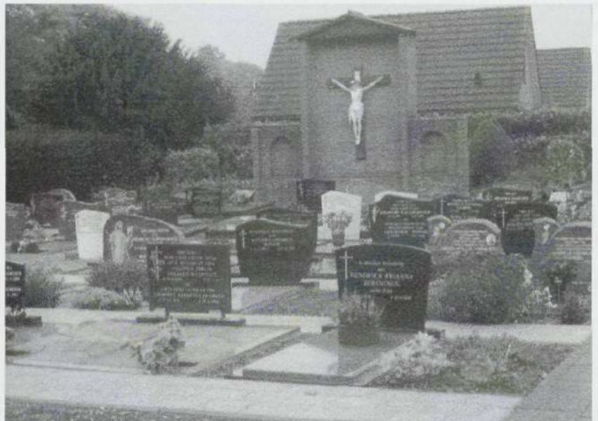
Een noodzakelijke uitbreiding van het kerkhof vond plaats rond 1983.

Rond 1983 werd het kerkhof uitgebreid. Het kruis werd zover mogelijk naar achter geplaatst,