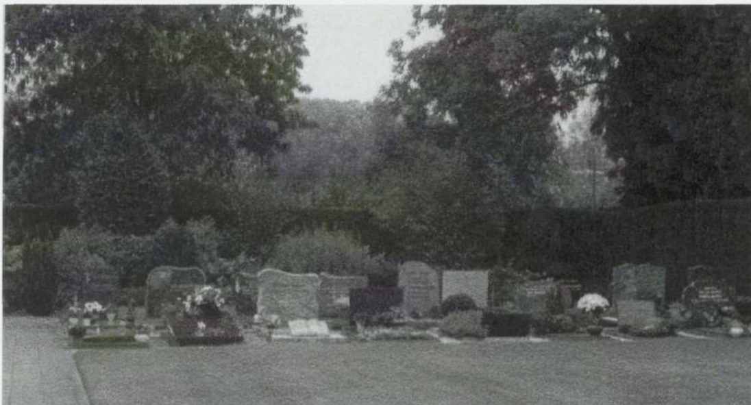
Een overzicht van de nieuwste uitbreiding, die is ingezegend door pastoor Zandbelt, gelijk met de inzegening van het monumentje voor diegenen die in ongewijde aarde zijn begraven (zie foto op pagina 12).

waardoor er weer een grote ruimte beschikbaar was. Tevens werd er een soort monument gemetseld waar het kruis aan kwam te hangen.