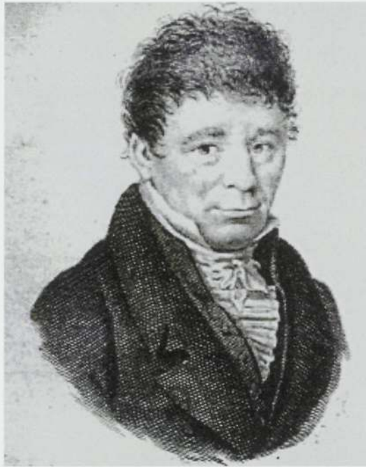
A.C.W. Staring, de dichter van de Wildenborch

Anthonie Christiaan Winand Staring werd geboren in 1767 in Gendringen. Hij studeerde zonder enige vorm van enthousiasme Rechten in Harderwijk dat er destijds een kleinschalig universiteitje op na hield. Na de rechtenstudie bekwaamde Staring zich met meer geestdrift in het buitenland in de landbouwwetenschap aan