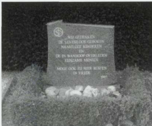
Op deze foto ziet u het in 1997 opgerichte monumentje voor de ongedoopte kinderen die vroeger in ongewijde grond begraven werden.

Niet gedoopten: De niet-gedoopte kinderen, en zij, die de Kerkelijke begrafenis onwaardig zijn, worden begraven op een voor hen bestemde plaats aan de linkerzijde van het lijkenhuis, zoo echter dat er voor de ongedoopte kinderen een afzonderlijk gedeelte bestemd zij, afgescheiden van het gedeelte dat bestemd is voor hen, die om misdaad of plichtsverzuim een Kerkelijke begrafenis onwaardig zijn.