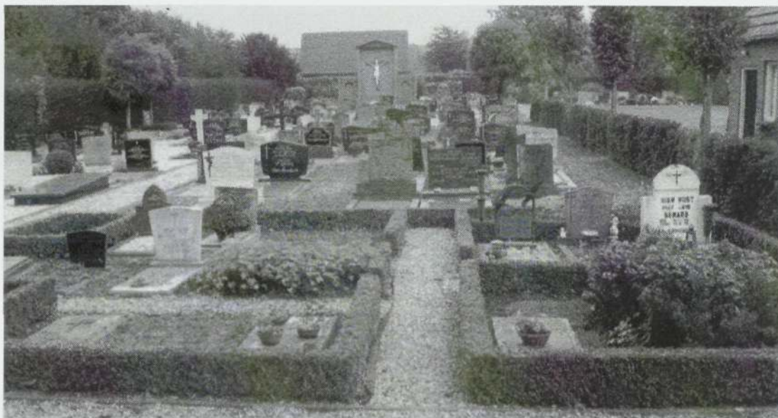
Een overzichtsfoto van de rooms Katholieke begraafplaats achter de Willibrorduskerk.