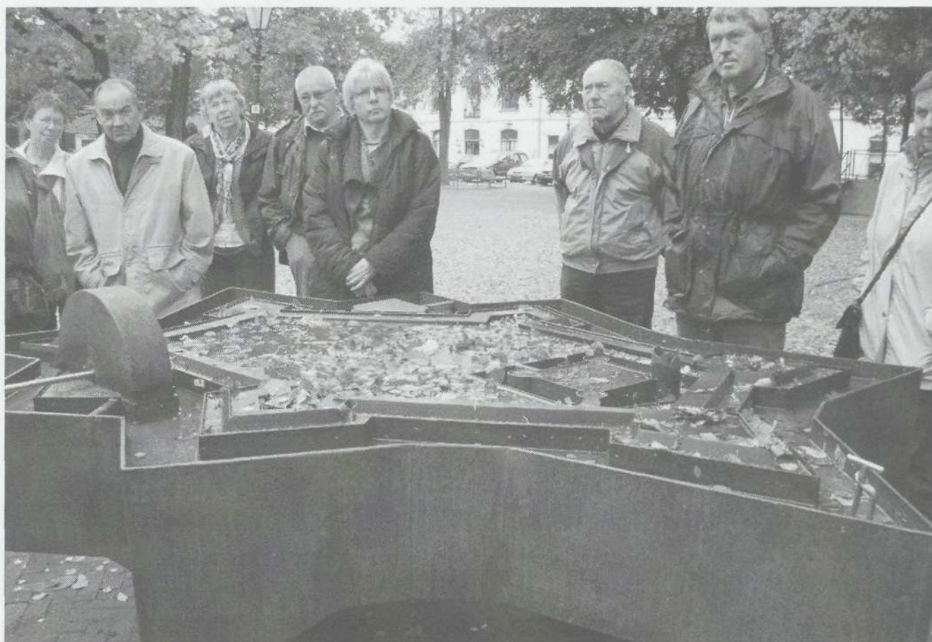
Maquette van het vroegere kasteel