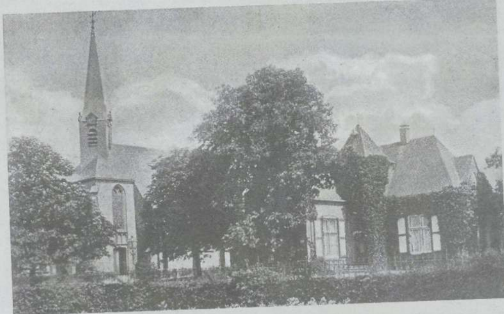
R.K. kerk met pastorie in Olburgen.

Aan de hand van oude foto's die op dezelfde plaats opnieuw genomen zijn, is te zien wat er in de loop der jaren is veranderd.