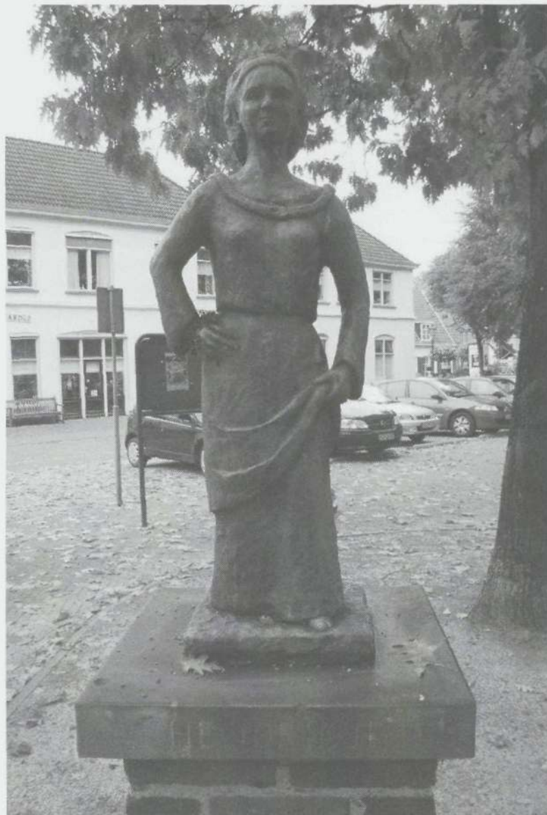
Hendrikje Stoffels 1626-1663

Hierna kreeg een ieder de gelegenheid om op eigen houtje de boekenstad Bredevoort nader te verkennen om vervolgens voldaan huiswaarts te keren. ■