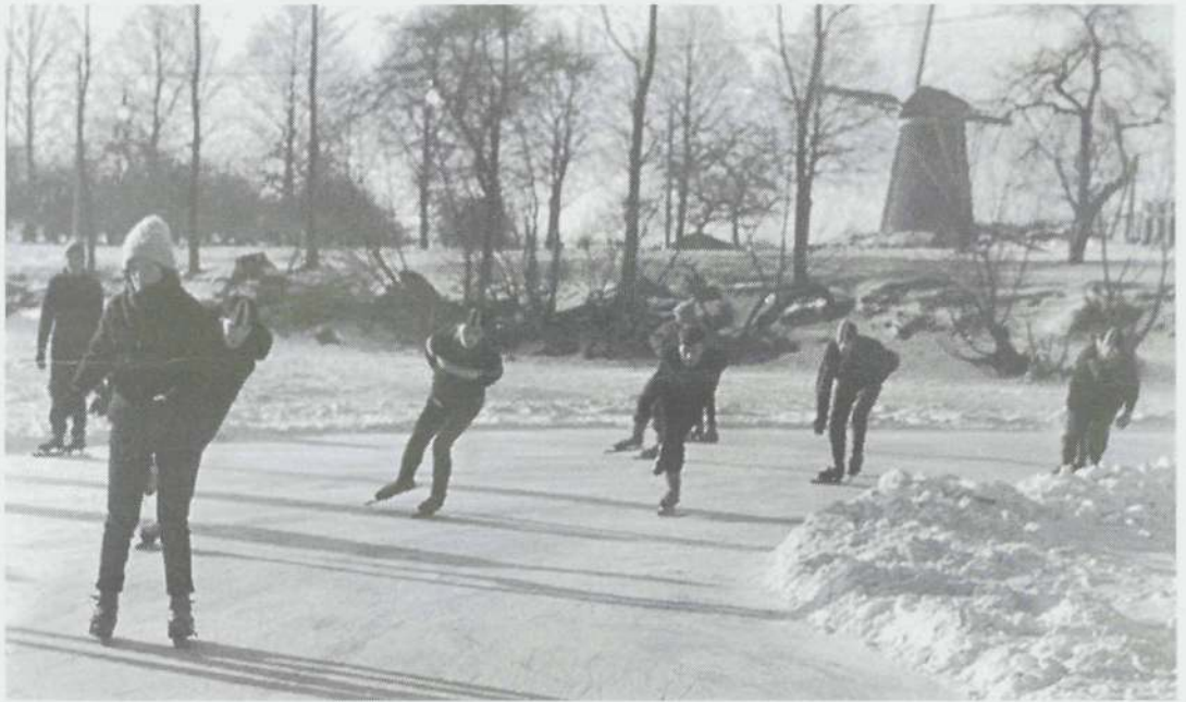
Winter 1962-1963, schaatsen op de Molenkolk.